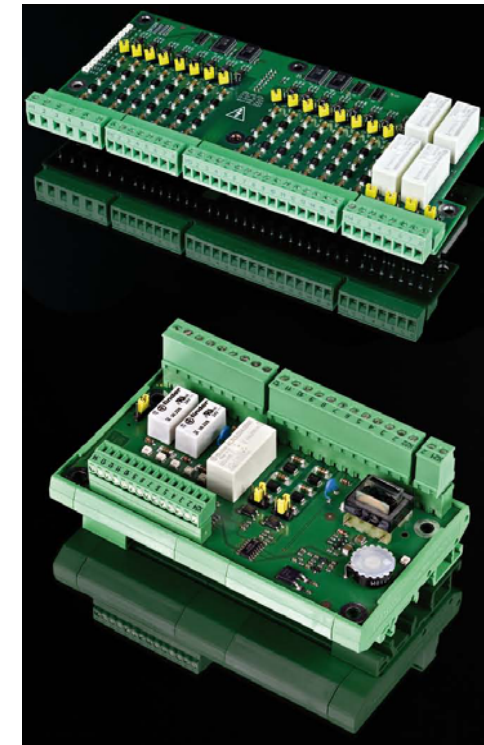
LMS-ADD und LMS-CAR Module zur Integration von Fremdsteuerungen in das System

Das integrierte AWE Modul ist TÜV-zertifiziert als Aufzugswärterersatz nach §20 der Aufzugsordnung.